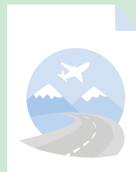
Ud i verden

Med udgangspunkt i et ugeskema planlægger det pædagogiske personale selv, hvilke lege og aktiviteter der skal understøtte læringsmålene. Og mange af aktiviteterne kan nemt indbygges i de daglige rutiner.