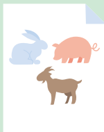
Dyr og naturen